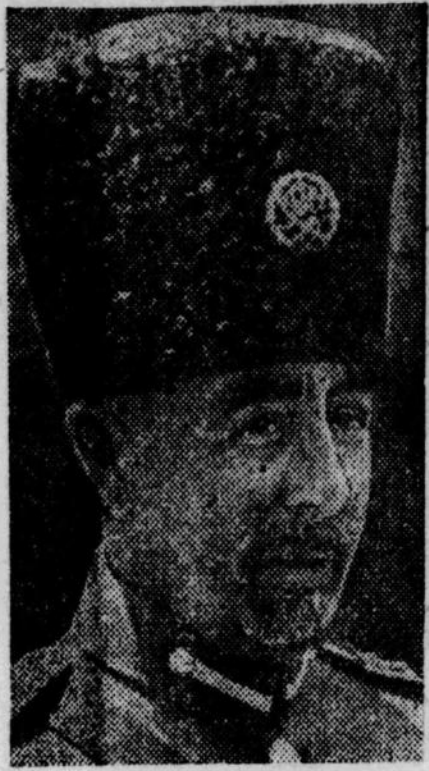
Masanja menghumus pedang.....!