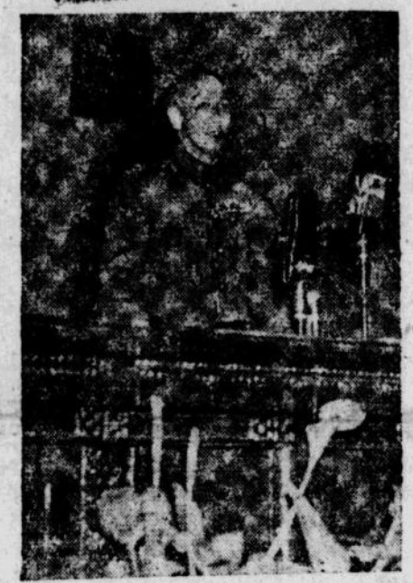
Chiang baru merantjang.....

Wakil2 dari 120 organisasi mengaku bitjara buat 100.000 orang Tionghoa Perantuan sekita mengadjukan "Pekan anti-Chiang" untuk memberitalken kepada orang2 sifat jang tidak menurut undang2 dasar dari kepresidenan Chiang dan dari hal kediktatorannja".